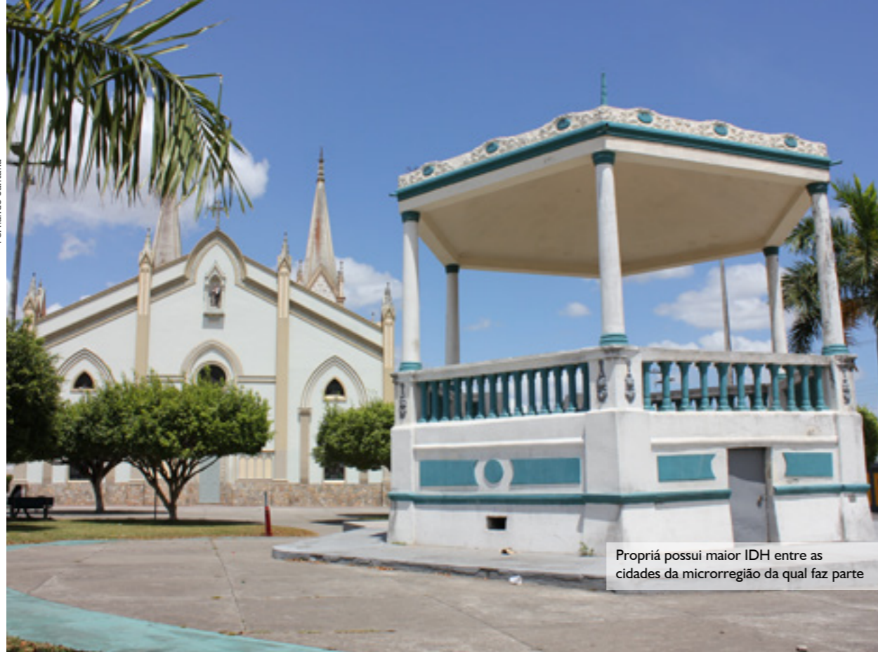
Propriá possui maior IDH entre as cidades da microrregião da qual faz parte