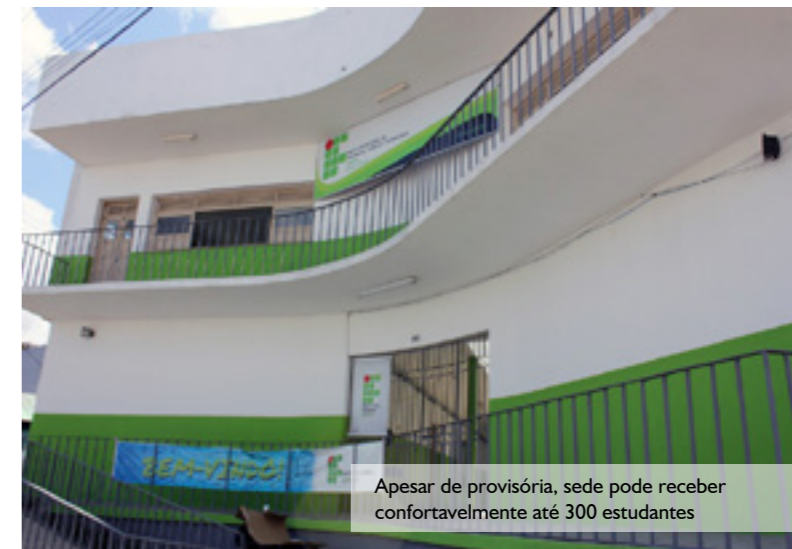
Apesar de provisória, sede pode receber confortavelmente até 300 estudantes