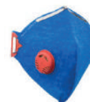
Máscara N95 PFF2