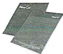
1000 UND. ENVELOPES... R$ 1.103,76