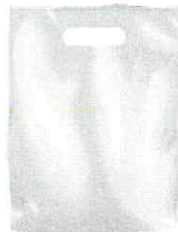
500 - SACOLAS PLASTICAS... R$ 461,25