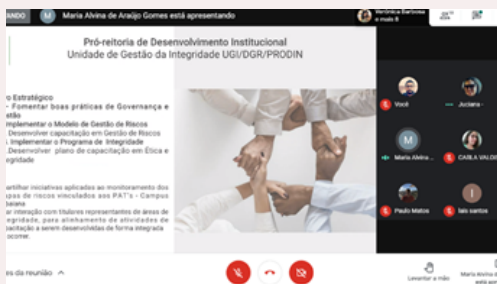
2ª Reunião Técnica com interlocutores da Reitoria/Campi