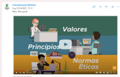
Divulgação da campanha #IntegridadeSomosTodosNós