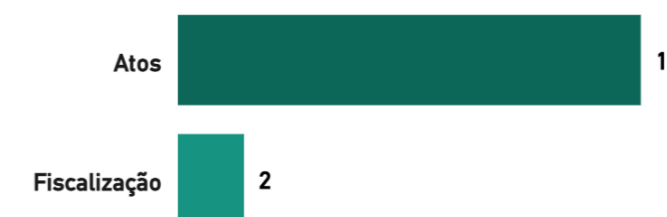
Gráfico 23: Processos do TCU em que o IFS foi parte em 2025

Em consulta ao Sistema Conecta-TCU, verificou-se que, no exercício de 2025, o IFS figurou como parte em 16 processos no âmbito do Tribunal de Contas da União. Desse total, 14 processos referem-se à apreciação de Atos e 2 processos a ações de Fiscalização.